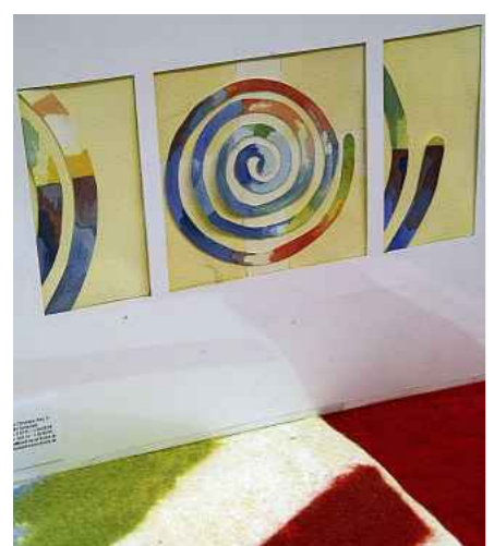
Die Spirale schmückt bald einen Raum der Justizvollzugsanstalt Gießen.