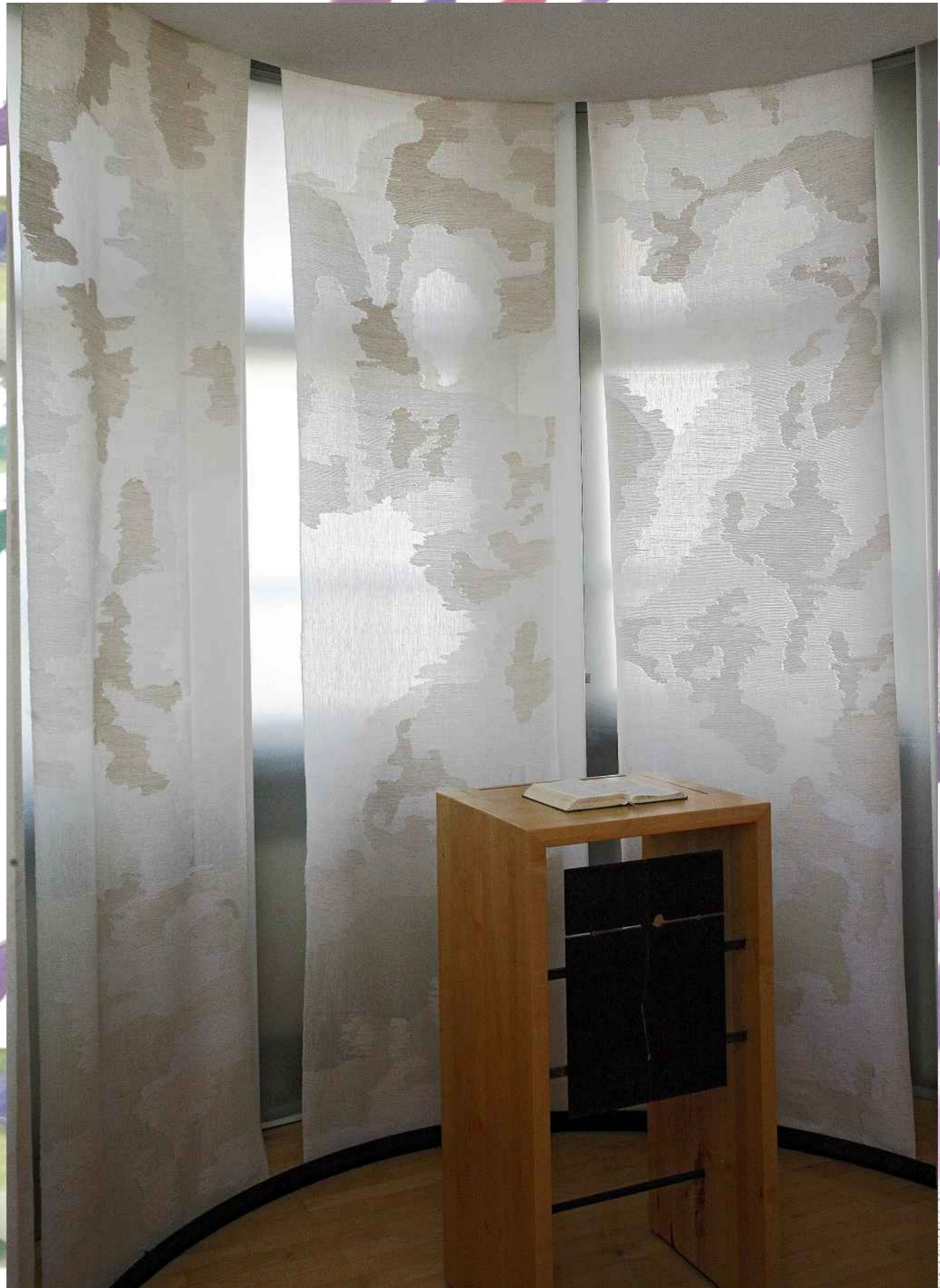
Im »Raum der Stille« im Alice-Hospital Darmstadt hängt ein Parament der Textilwerkstatt Darmstadt.