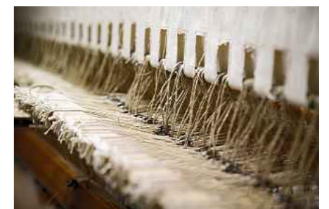
Jeder Griff ist Handarbeit: Am Hochwebstuhl entstehen farbenfrohe Bahnen.