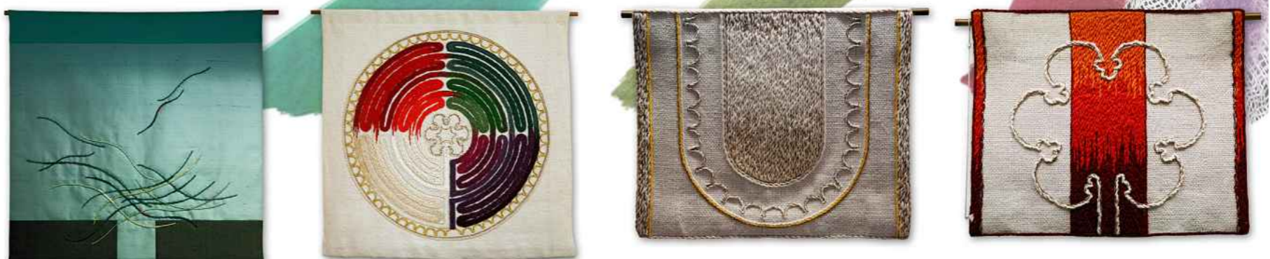
Reiche Symbolsprache: Textilien für Kirchen regen zur Meditation an.

zu neuer Blüte. Er gilt als Erneuerer der Paramentik. Im Jahr 1858 gründete er einen Paramentenverein, dem viele Nachahmer in Diakonissenhäusern folgten. Einige dieser Werkstätten bestehen bis heute; die Darmstädter Textilwerkstatt zum Beispiel, die im Jahr 1891 gegründet worden ist. Heute beschreiten die Paramentikerinnen neue Wege jenseits traditioneller Formgebung , arbeiten mit Künstlern zusammen und gehen mit den Textilien stärker in den Kirchenraum hinein – um ihre Kunst weiterzuentwickeln, aber auch, um ihren Broterwerb zu sichern. »Lass einen Vorhang aus roter und blauer und karmesinroter Wolle weben und mit Kerubenbildern besticken; als Kettfäden nimmst man gewirntes Leinen.« (2. Mose, 31)