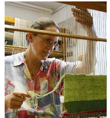
Am Hochwebstuhl entstehen Gobelins – wie seit vielen hundert Jahren.