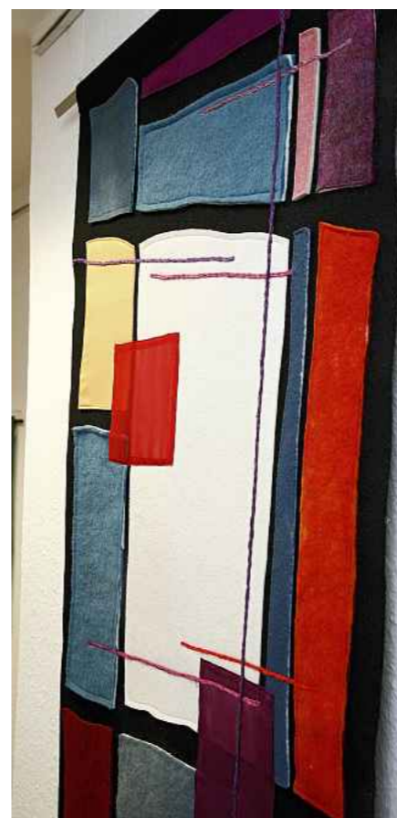
Abstrakte Form- und Farbensprache als Baustein für die Liturgie.

als Anschauungsobjekt für einen ökumenischen Kirchentag. Auf dem Buchstaben T in Grün und Orange auf rötlichem Grund verteilen sich die römischen Ziffern I bis XII – Zeichen für die zwölf Stationen des Kreuzwegs Jesu? »Es hat auch schon jemand die zwölf Apostel darin gesehen«, erzählt Marie-Luise Frey-Jansen. So soll es sein: Als Betrachter in eine Meditation über die Bedeutung des Paraments im Kontext der Kirche kommen – und über